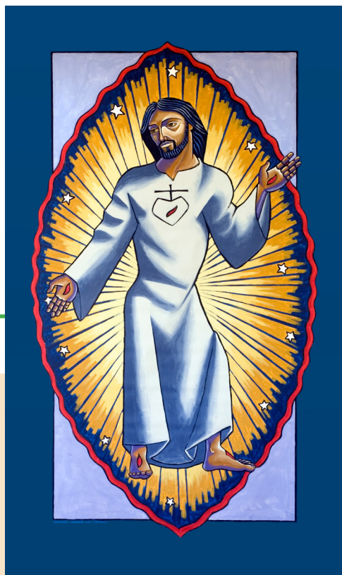
Cristo en gloria por el Hno. Michael Moran, CP

Espíritu Santo, que con tu luz orientas este mundo hacia el amor del Padre y acompañas el gemido de la creación, tú vives también en nuestros corazones para impulsarnos al bien. Alabado seas.